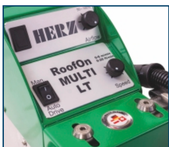
Roofon Multi LT